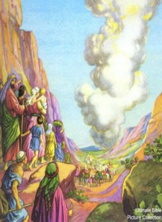
Ultimate Bible Picture Collection